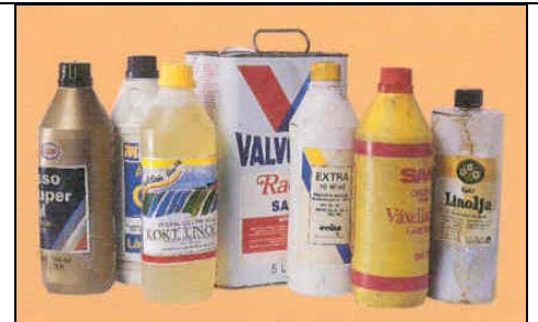
Olyada-Baaruunta & Biraha waxaa ku jira maaddooyin dhaliya kansar iyo maaddooyin kale oo sun ah.