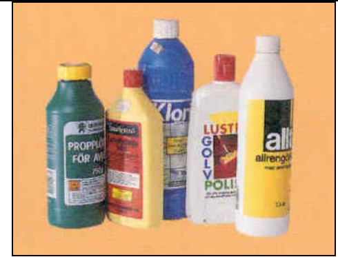
Maaddooyinka-Nadaafadda waa inaan la raacinin bacda-qashinka ama biyaha musqulaha.

S awirada soo socda waxa ay ku tusinayaan qashimada sunta ah ee guryaha ka soo baxi kara kuwaas oo halis ku ah noloshada dadka, xayawaanka iyo degaanka dabiiciga ah, haddii aanan si habboon loo xanaaney.