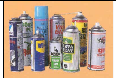
Qalabka-Wax-Lagu-Buufiyo waxaa ku jira maaddooyin dhaliya kansar iyo maaddooyin kale oo sun ah.